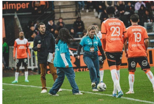
Match Lorient-Lens 11/2023